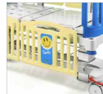
Variante colore disponibile su richiesta Colour version available upon request Versión en color disponibles bajo petición Cette couleur est disponible sur demande