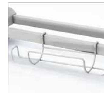
Art. 346069 Porta bombola ossigeno. Oxygen cylinder holder. Porta bottella de oxígeno. Porte-bouteille oxygène.